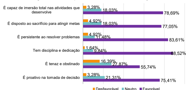
Figura 1 – Comprometimento e determinação.

Na Figura 1, observam-se as seis primeiras características, que correspondem ao quesito “Comprometimento e Determinação”.