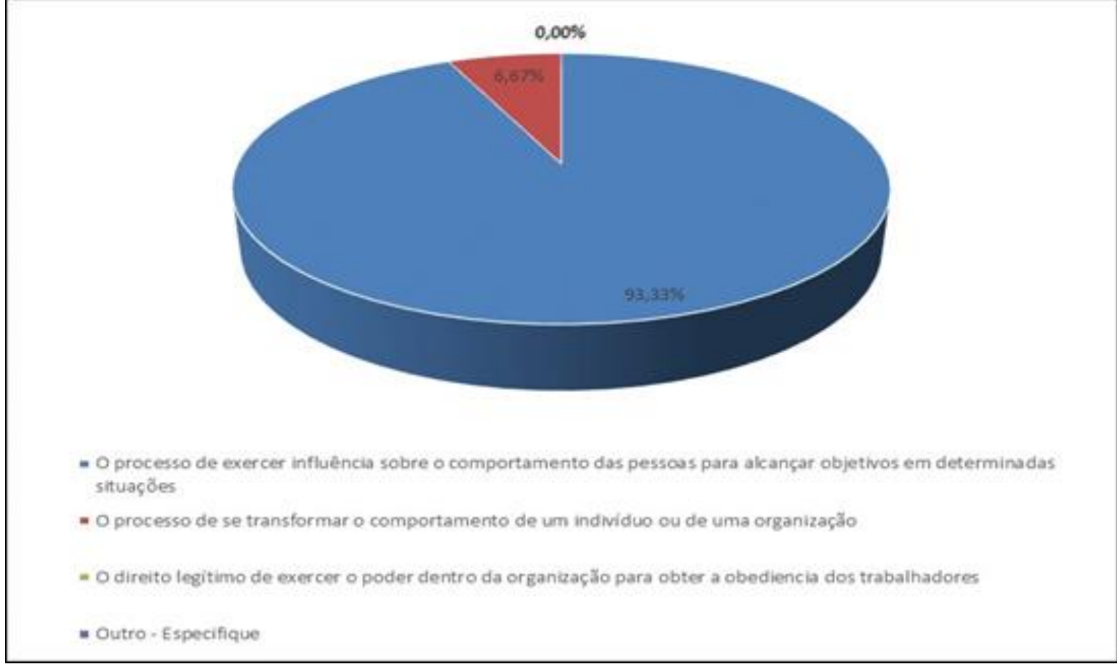
Figura 1 – Conceito de liderança